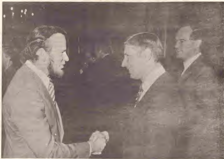
Consehero General, Sr. Betico Croes, y Ministro Presidente di Hulanda, Sr. A. van Agt, durante un ocasion ameno na Hulanda na Januari 1979.

gobierno lo no duna soberania na ningun isla contra voluntad di e otro partinan di Reino. Esaki segun e tratadonan.